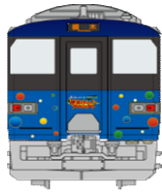
政宗ブルーライナー