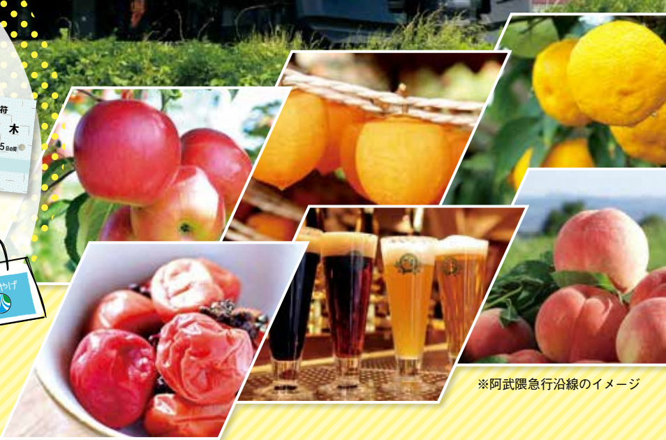
※阿武隈急行沿線のイメージ