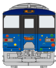
政宗ブルーライナー