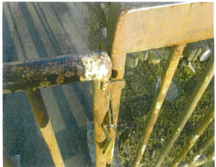
南京錠がかけられない状態です。