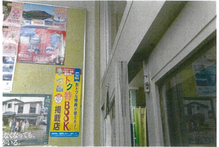
駅舎が歪んで？玄関ドアが開閉出来ない。