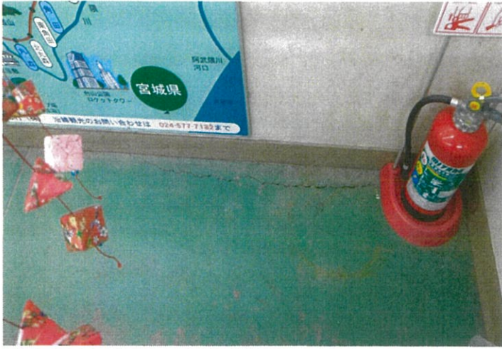
待合室内にも新しい亀裂が増えています。