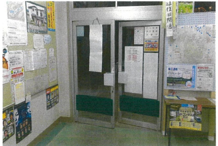
戸締り出来ない状態です。