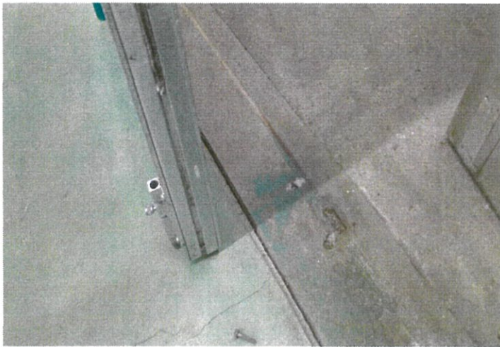
ドア止め具が変形してドアを固定出来ない。