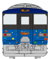
政宗ブルーライナー