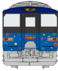
政宗ブルーライナー